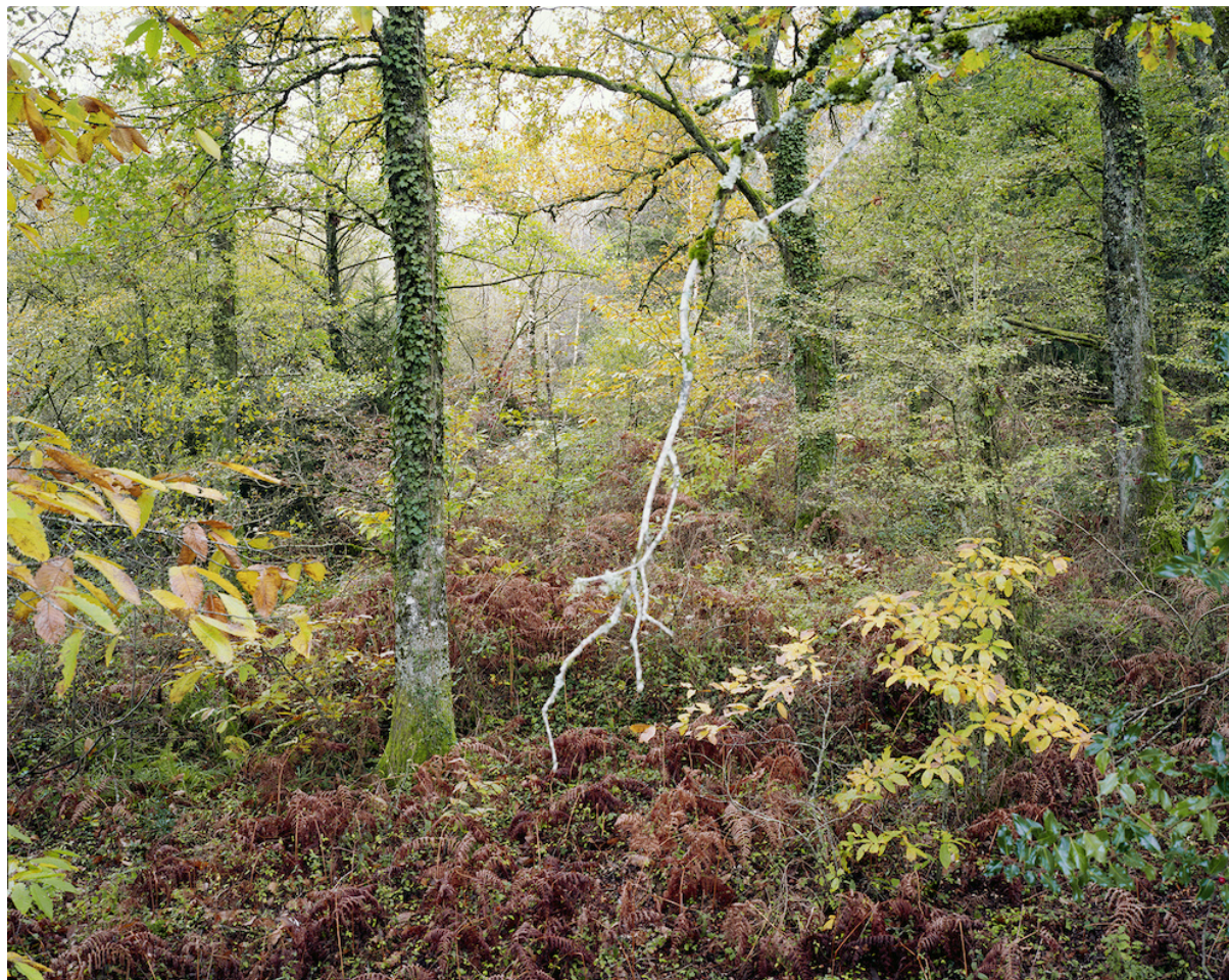
Thierry Girard, photographie extraite de Paysages insoumis , 2012.

photographie est d'abord employée pour documenter l'évolution des aménagements et les conceptions que se font les hommes de leur place au sein de la nature (Sophie Ristelhuber). Nombreux sont les photographes qui se sont ensuite immergés en forêt et les ont arpentés (Patrick Tourneboeuf). Danièle Méaux rend également compte d'un regard photographique au plus près des feuillages et des végétaux. Les photographes nous font entrer progressivement à l'intérieur des sous-bois, invitant à éprouver des variations de lumière (Chrystel Lebas).