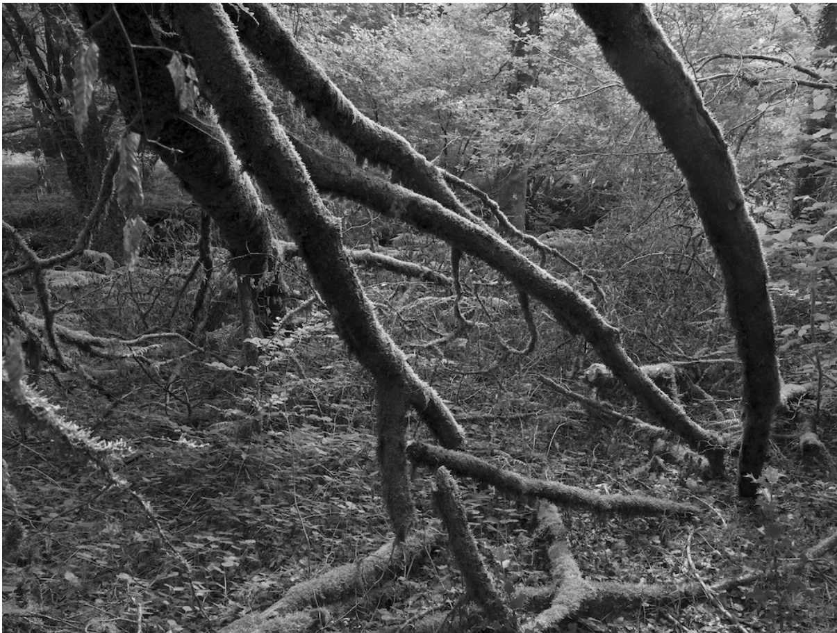
Branches mortes, forêt de Lacam-d'Ourcet / Dead branches, Forêt de Lacam-d'Ourcet Céline Clanet, « Branches mortes, forêt de Lacam-d'Ourcet », série Ground Noise , 2023.