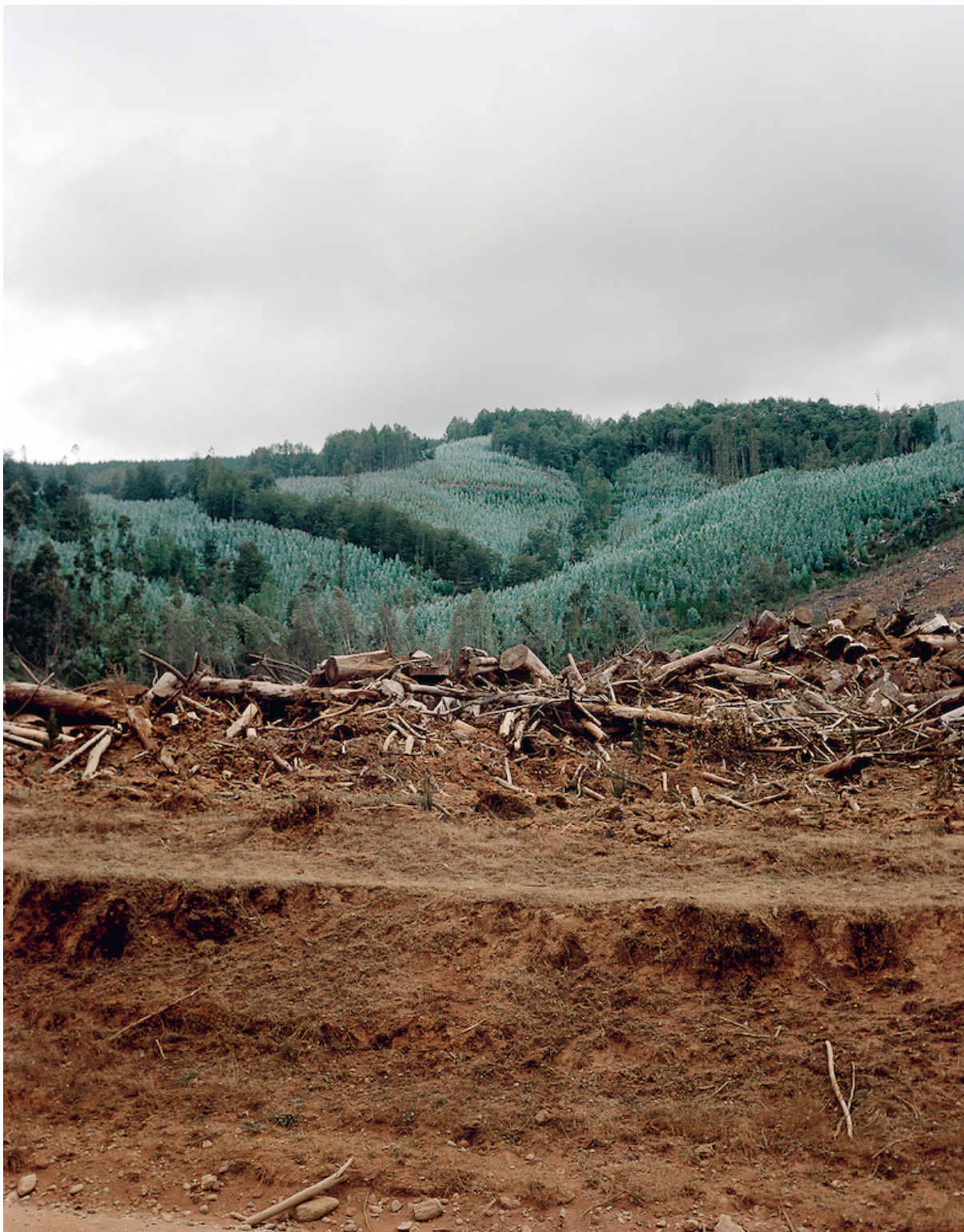
Ritual Inhabitual, photographie extraite de Forêts géométriques. Lutte en territoire Mapuche , 2022.